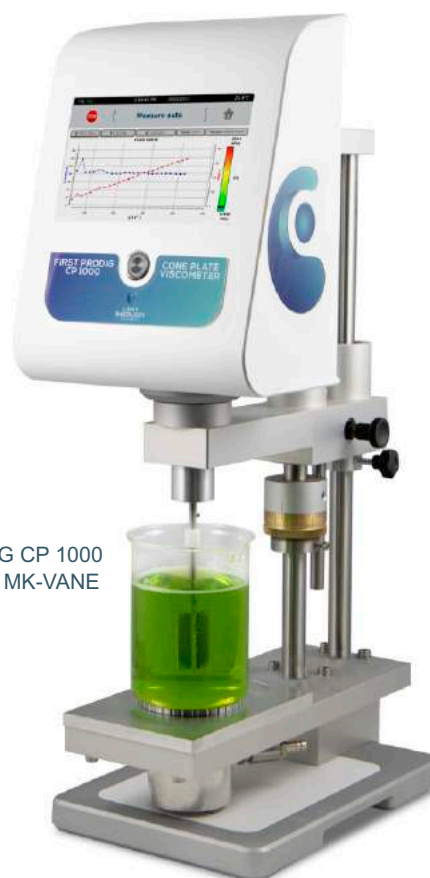
FIRST PRODIG CP 1000 + MK-VANE