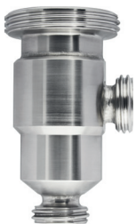
Bended Cell CD25 (PN 121038)