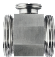
Straight Cell LD100 (PN 121032)