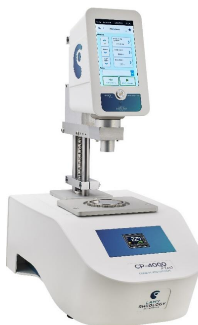
Рисунок 1 – Общий вид реометров: а – модификации DSR500; б – модификации RM200; в – модификации DSR500 CP4000; г – модификации RM200 CP4000